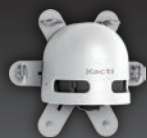
フォクレコ フォークリフト取付型 セーフティカメラシステム SX-DB100