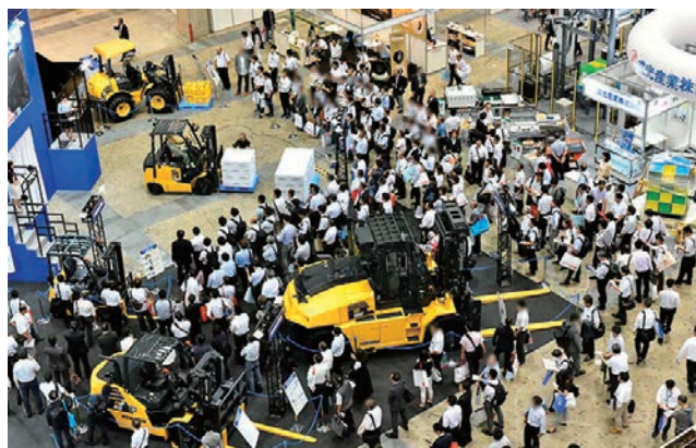
会場には新しい物流システムの構築に役立つ最先端の機器や装置が展示され、多くの人々が集まる。

提供され、新たなビジネスを生み出す場となる本展は、企業にとって課題解決の場となるはずだ。本特集では同展のテーマに合わせ、物流関連機器を集中的に掲載。新たなビジネスのヒントとなる最先端の機器やサービスを紹介する。